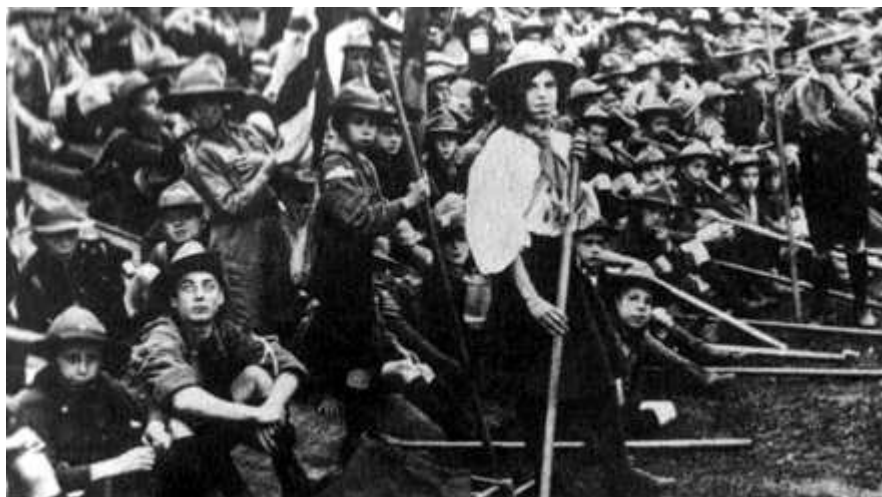
Figura 02: Foto do Raly Escoteiro, Palácio de Cristal, Londres – Uma menina uniformizada com trajes escoteiros.

“O Escotismo é um movimento, não uma organização” (BADEN-POWELL, 2009), e enquanto movimento poderia ser modificado, recomposto com o tempo, com as experiências e com as mudanças. A circunstância que levou B.-P. a criar o movimento bandeirante foi a presença de mulheres entre escoteiros.