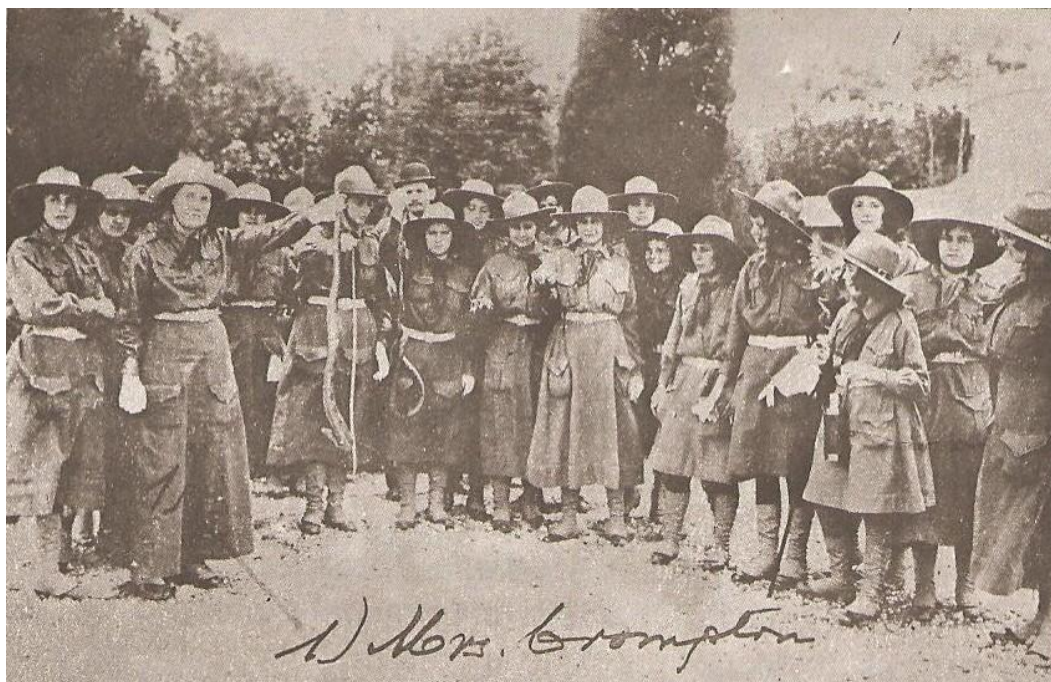
Figura 07: Foto de atividade externa das Escoteiras de São Paulo no Instituto Butantã.