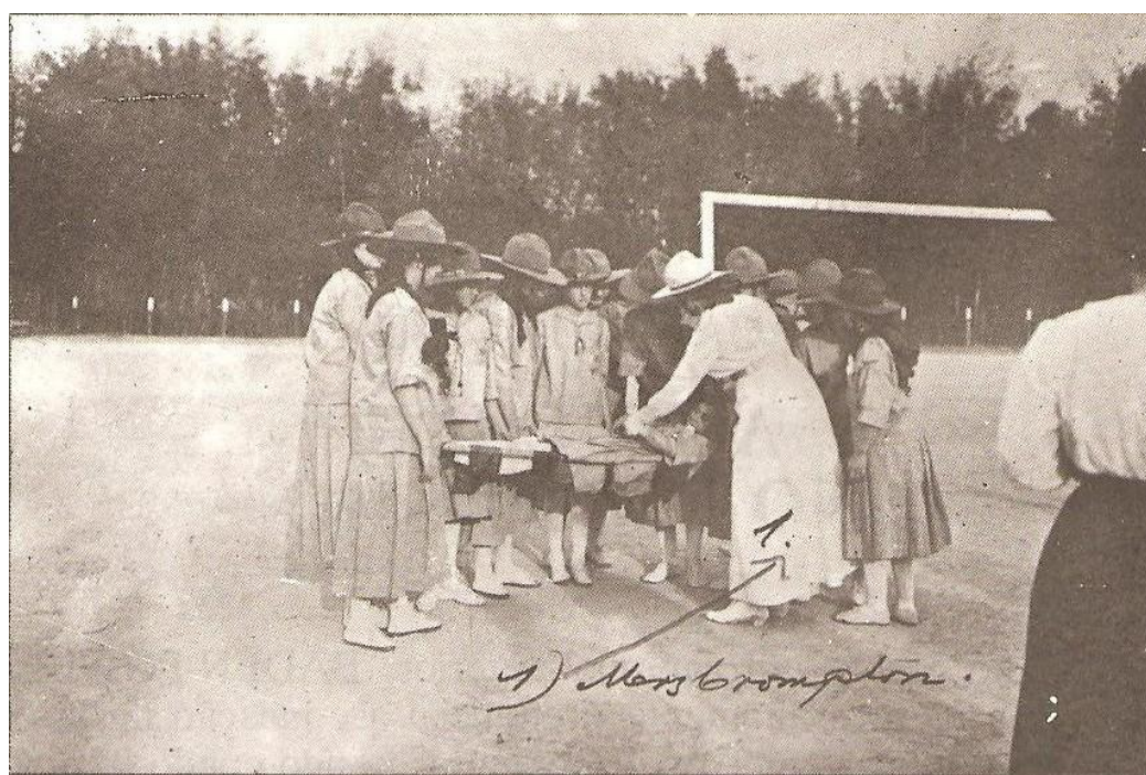
Figura 06: Foto de exercícios de Primeiros Socorros realizados no Parque Antártica.