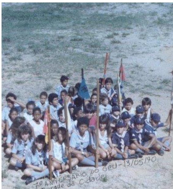
Figura 08: Foto de atividade do GEU no Parque da Cidade, em comemoração ao aniversário do grupo.