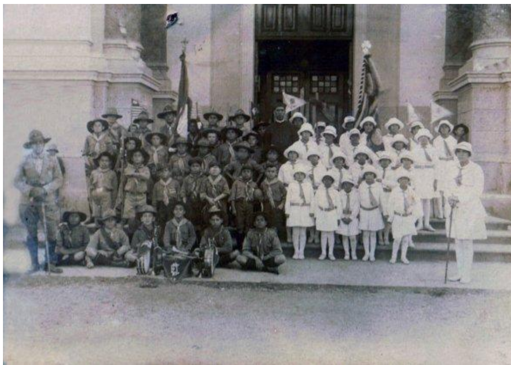
Figura 01: Foto de escoteiros do 1º Grupo Escoteiro São Paulo (esquerda) e um grupo de Bandeirantes (direita) Data: Primeira metade do século XX.