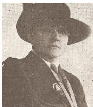
Figura 04: Foto de Jerônima Mesquita quando residia em Paris

nas concepções culturais do seu período. Filha de rico cafeicultor, José Jerônimo de Mesquita, ela teve acesso à educação, tendo estudado no Brasil e na Europa, neste último, ela travou contato com os movimentos iniciais do escotismo. Atuou como voluntária da Cruz Vermelha no Brasil, e em outros países como França e Suíça durante os acontecimentos da Primeira Guerra Mundial. Esteve entre os fundadores do movimento bandeirante no Brasil, em 1919. Lutou pelo direito das mulheres, inclusive pelo voto, lançando em 1934 o Manifesto Feminista, como já foi tratado anteriormente. Em 1947, fundou o Conselho Nacional de Mulheres e de acordo com a Lei nº 6791 de 09/06/1980, o dia 30 de abril, o dia de seu nascimento, é comemorado o Dia Nacional da Mulher (SCUMAHER; BRAZIL, 2000, p. 290).